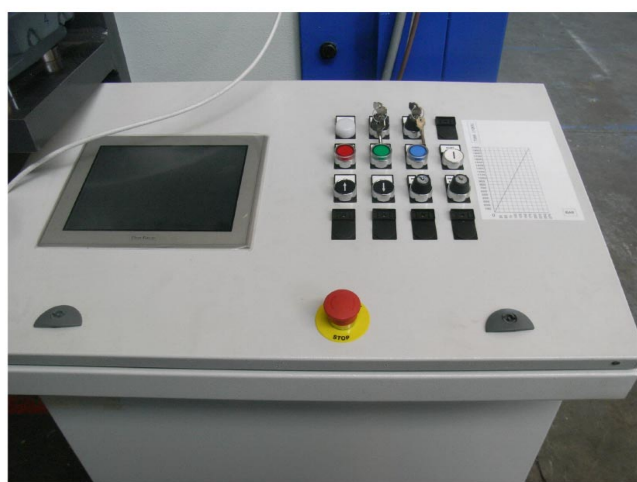
Consolle di comando facile ed intuitiva

POSSIAMO COSTRUIRE PRESSE SIMILI CON POTENZE FINO A 4000 TONN E PIANI DI LAVORO FINO A 6000mm x 2500mm